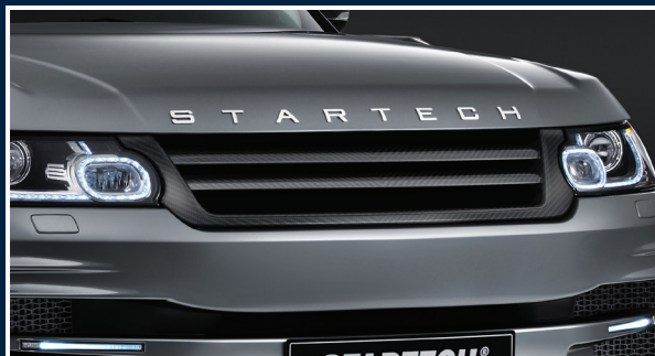
LW-700-20 Carbon Kühlergrill, high-gloss finish Carbon grille, high-gloss finish