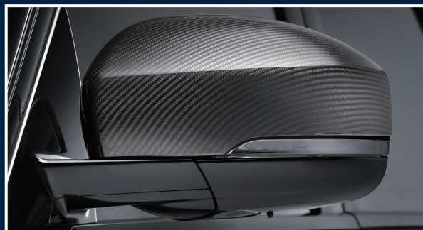
LG-700-30 Carbon Spiegelcover, high-gloss finish, Satz Carbon mirror covers, high-gloss finish, set