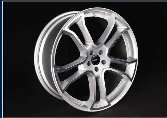
MONOSTAR R , 10J x 22“, einteilig, silber, vollpoliert MONOSTAR R , 10J x 22“, single piece, silver, full polished