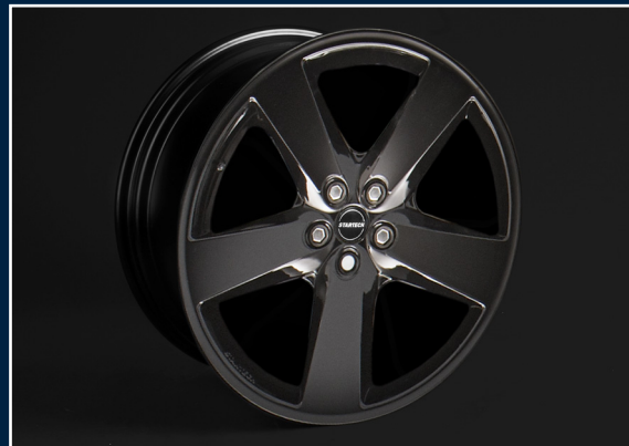
MONOSTAR IV , 5-Speichendesign, 10J x 22“, Sonderlackierung, schwarz glänzend oder matt MONOSTAR IV , 5 spoke design, 10J x 22“, special painting black high-gloss or matt