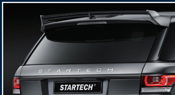
LW-700-40 Carbon Cover Heckdeckelleiste, high-gloss finish Carbon trunk panel cover, high-gloss finish