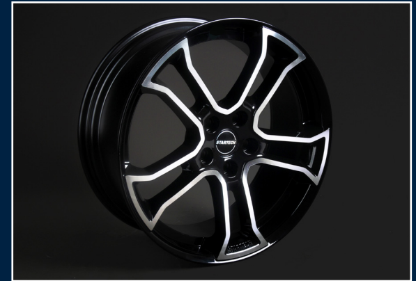
MONOSTAR R , 10J x 22“, einteilig, schwarz, Felgenstern silber, vollpoliert MONOSTAR R , 10J x 22“, single piece, black, centre silver, full polished