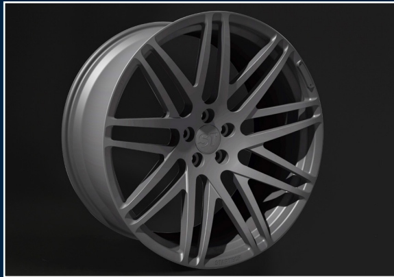
MONOSTAR S , Kreuzspeichendesign, 11J x 23“, einteilig, geschmiedet, „Titan“ anthrazit matt lackiert MONOSTAR S , Cross-Spoke design, 11J x 23“, single piece, forged, „Titan“ colour anthracite matt painted