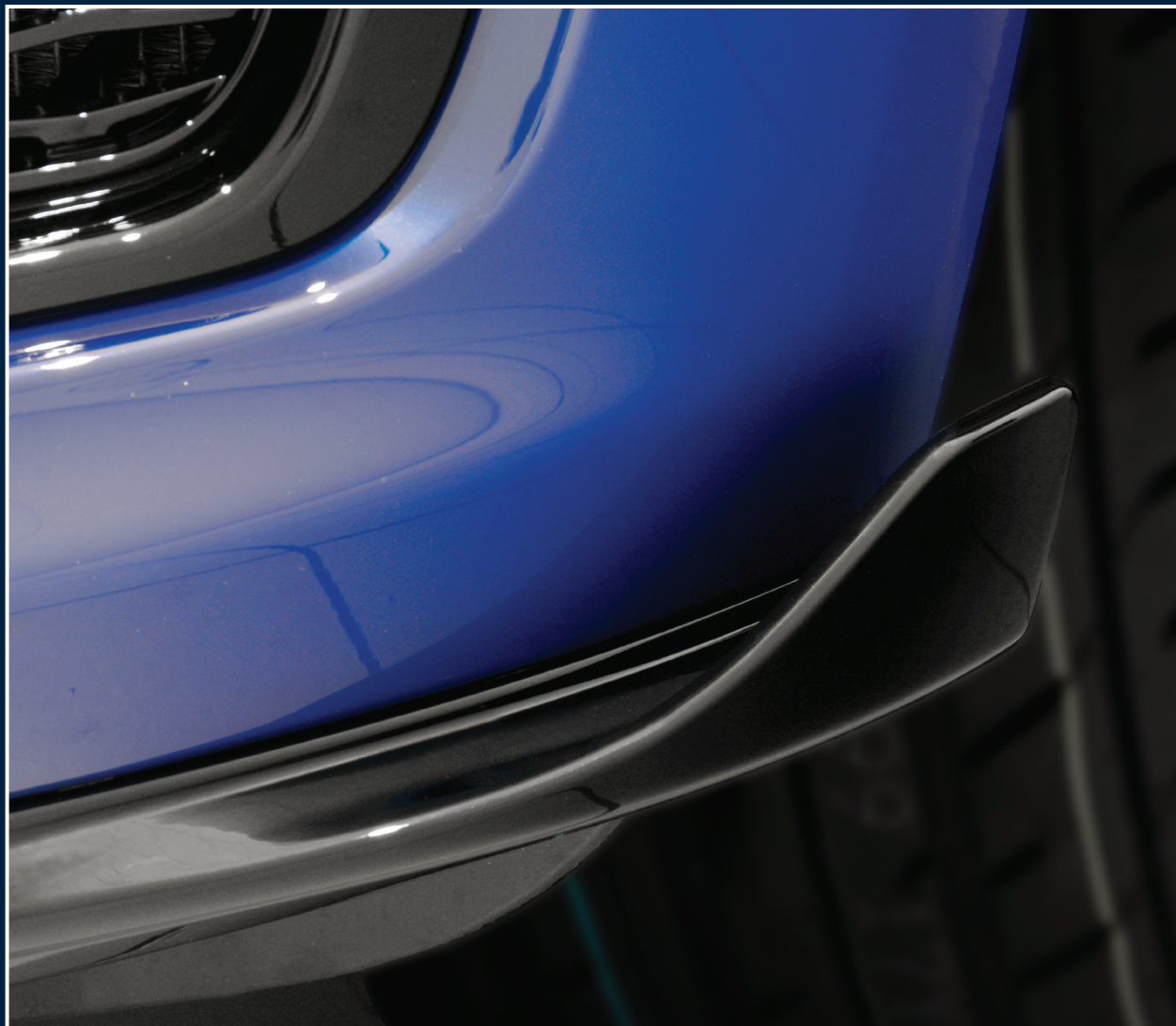
LW-250-00 Front Flaps, hochglanz schwarz, Satz Front Flaps, high gloss black, set