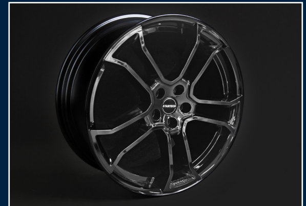
MONOSTAR R , 10J x 22“, einteilig, Speziallackierung, schwarz glänzend oder matt MONOSTAR R , 10J x 22“, single piece, special coating black high-gloss or matt