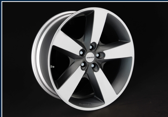
MONOSTAR IV , 5-Speichendesign, 10J x 22“, einteilig, anthrazit, vollpoliert MONOSTAR IV , 5 spoke design, 10J x 22“, single piece, anthracite, high-gloss polished