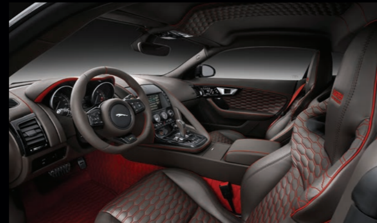
FT-857-00* / XJ-877-00

SIDE SKIRT ATTACHMENT ELEMENT IN CARBON HIGH-GLOSS FINISH