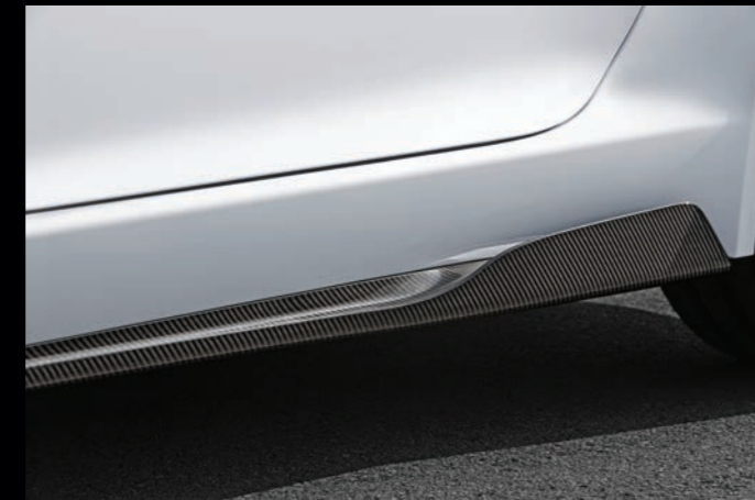
FT-300-00 / FT-700-30

BONNET AIR INTAKES IN CARBON HIGH-GLOSS FINISH