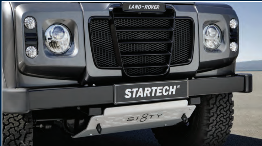
STARTECH Frontelement Series 3.1 mit Unterfahrschutz STARTECH Frontelement Series 3.1 with underride protection