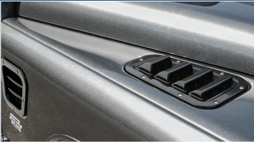
STARTECH Lufteinlässe, 3-teilig STARTECH air intakes, 3-pieces