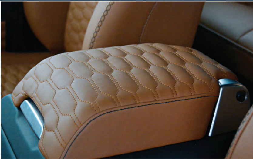
STARTECH Mittelarmlehne, gesteppt STARTECH Center arm rest with stitching