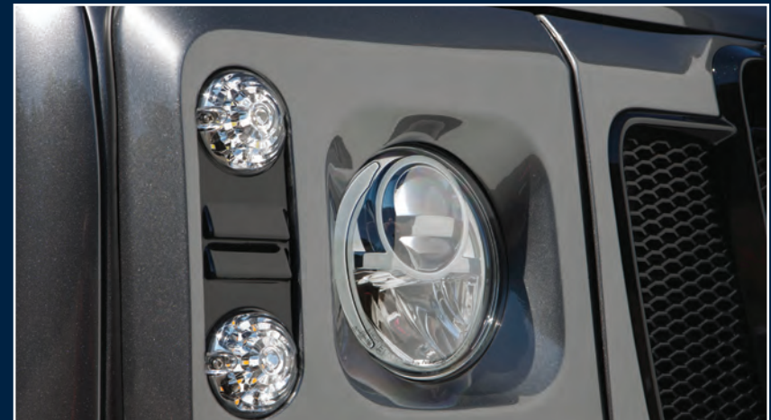
STARTECH LED-Hauptscheinwerfer mit LED-Tagfahrlicht und Blinker STARTECH LED headlights with LED daytime running lights and indicator lights