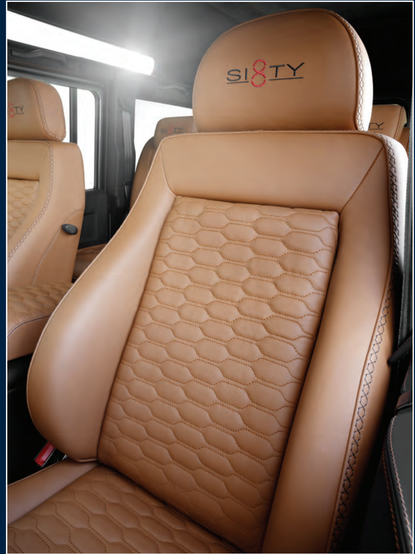
Sportliche Komfortsitze vorne mit Sitzheizung Front Sport-Comfort seats with heating function