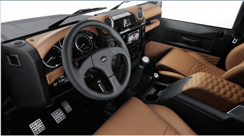
STARTECH Volllederausstattung in „Tan/Ebony“ STARTECH Complete leather interior „Tan/Ebony“