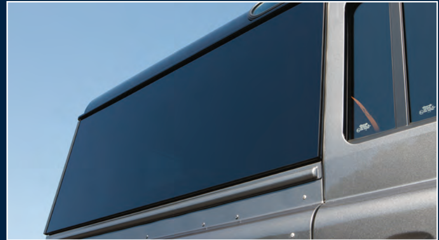
Getönte Panoramamascheiben, hinten Panorama glass for rear compartment, tinted