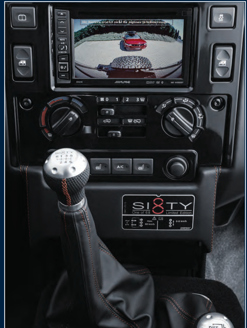
ALPINE Multimedia/Navigationssystem 4x 50 W mit Rückfahrkamera ALPINE Multimedia/Navigation system 4x 50 W including rear camera