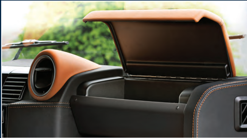
STARTECH Handschuhfach STARTECH glove box