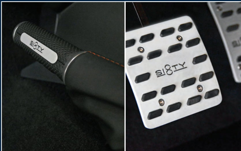
STARTECH Handbremshebel und Pedalauflagen Aluminium, 3-teilig STARTECH Handbrake lever and Aluminium pedal pads, 3-pieces