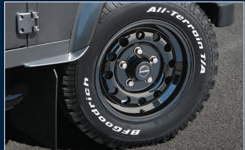
STARTECH 18" Monostar D Leichtmetallräder schwarz Hochglanz mit Reifen 265/65 R18 BF Goodrich* STARTECH 18" Monostar D light alloy wheels gloss black with 265/65 R18 BF Goodrich tires*