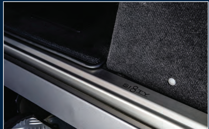
STARTECH Einstiegsleisten „SIXTY8“, Edelstahl, 5-teilig STARTECH Entrance panels „SIXTY8“, stainless steel, 5-pieces