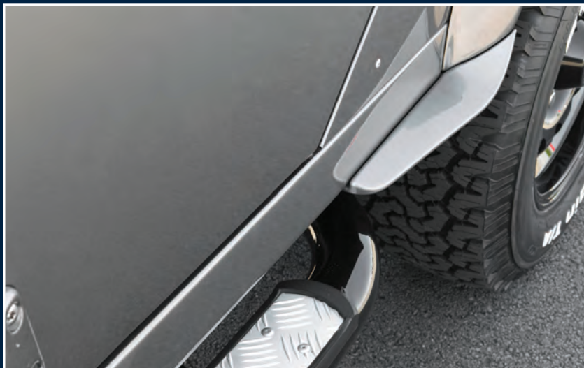
STARTECH Fenderflaps 6-teilig STARTECH Fender Flaps 6-pieces