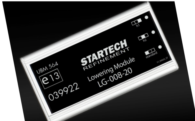
LG-008-20 Tieferlegungsmodul, ca. 25 mm Suspension lowering module, approx. 25 mm