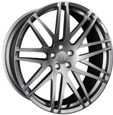
MONOSTAR S , Kreuzspeichendesign, 11J x 23", einteilig, geschmiedet, "Titan" anthrazit matt lackiert MONOSTAR S , Cross-spoke design, 11J x 23", single piece, forged, „Titan“ colour anthracite matt painted