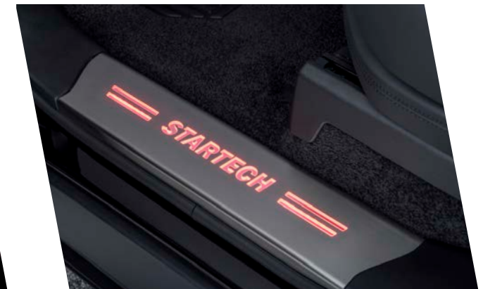
LG-350-00/RT Einstiegsleisten-Satz, beleuchtet in blau oder rot, Edelstahl, 2-teilig Entrance panel set, illuminated in blue or red, stainless steel, 2-pieces