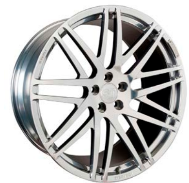
MONOSTAR S , Kreuzspeichendesign, 11J x 23", einteilig, geschmiedet, keramik poliert MONOSTAR S , Cross-spoke design, 11J x 23", single piece, forged, ceramic polished