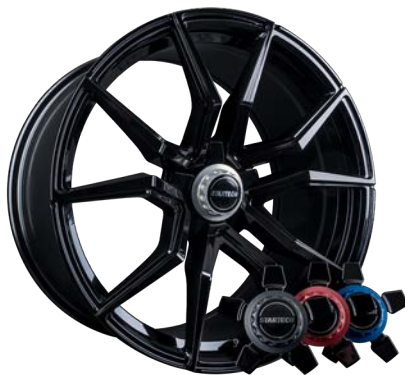
MONOSTAR M , 10J x 22", schwarz glänzend, inkl. Aluminium-Nabenkappe in Zentralverschlussoptik MONOSTAR M , 10J x 22", glossy black, with aluminium center caps in center lock design