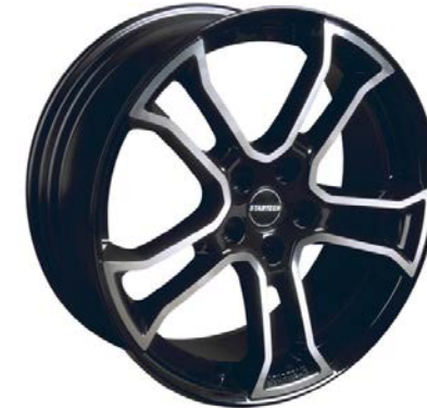
MONOSTAR R , 10J x 22", einteilig, schwarz, Felgenstern silber, vollpoliert MONOSTAR R , 10J x 22", single piece, black, centre star silver, full polished