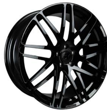
MONOSTAR S , Kreuzspeichendesign, 11J x 23", einteilig, geschmiedet, schwarz glänzend MONOSTAR S , Cross-spoke design, 11J x 23", single piece, forged, glossy black