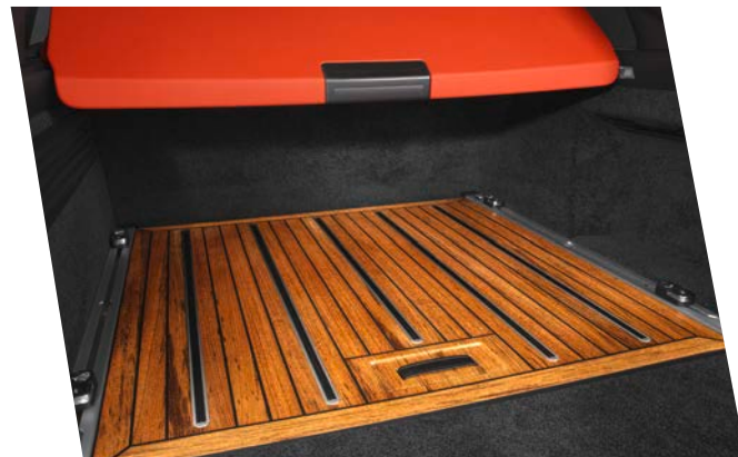
LG-880-10 STARTECH Teak Holzboden für den Kofferraum STARTECH Teak wood floor for luggage space