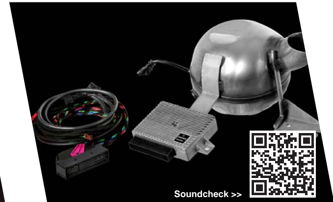
LG-650-10 SoundXtra - Soundmodul für V6 und V8 Dieselmotoren, Export-Version SoundXtra module for V6 and V8 Diesel, export version