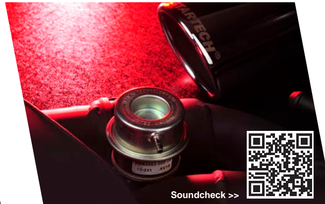
LG-670-30 Klappen-Sportauspuff für V8 5,0 l ab Kat., elektronisch verstellbar, Export-Version Valve controlled sports exhaust for V8 5.0 l ex. catalyst, electronically adjustable, export version