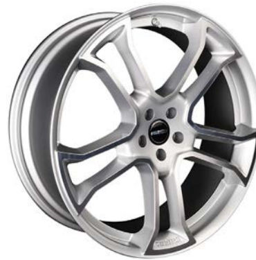
MONOSTAR R , 10J x 22", silber, vollpoliert MONOSTAR R , 10J x 22", silver, full polished